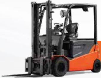
رافيعى كارهبايى / 1-3.5 تۆن