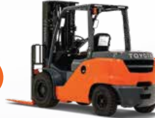
رافيعى گاز / 1-8 تۆن