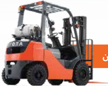
رافيعى گاز / 1-8 تۆن