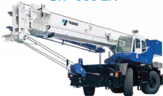
GR - 300 EX